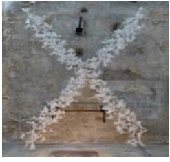
2000 Galerie A. Lagier, L'Isle sur Sorgue Fiesta, Docks des Suds, Marseille Ateliers Portes Ouvertes, Marseille